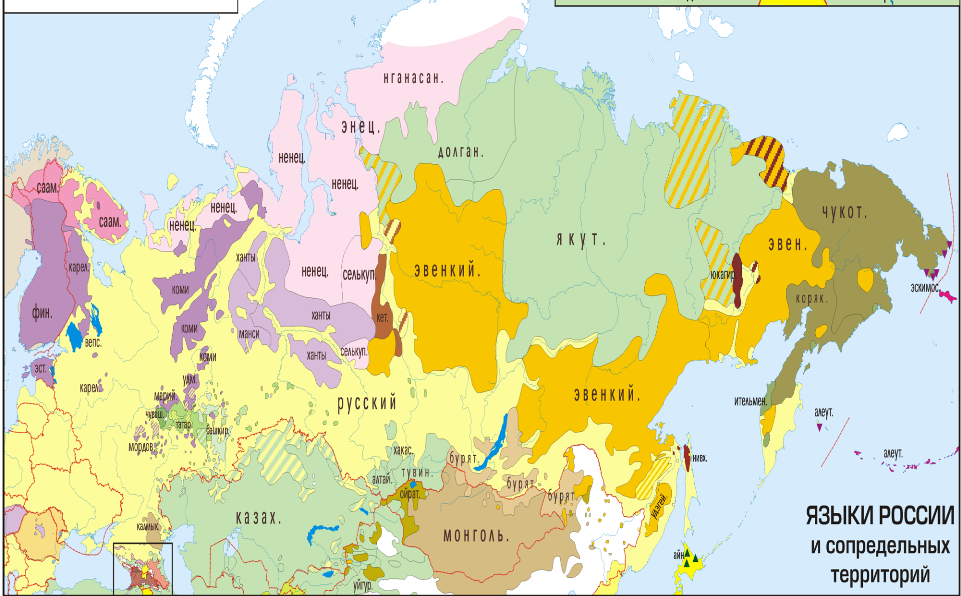
ЯЗЫКИ РОССИИ и сопредельных территорий