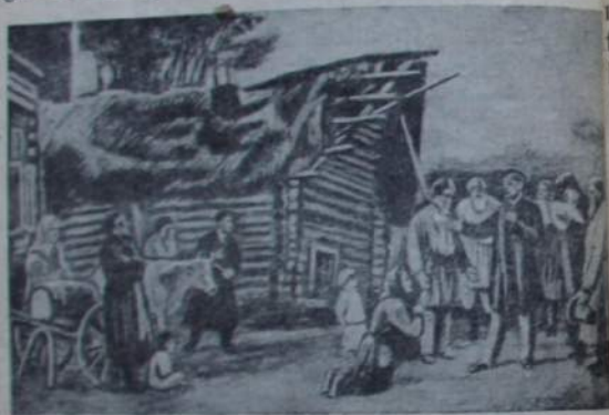
Uradnik (həgdigu) dunnəwə hawalzarilduk ələwə macaləwə gasaran.

Təgəməŋ nuŋniwunin bikicildu zemstwadəwər bajasal oŋkowitzicildulatin tinigkitin. ŋilwa həgdigulwi biliwkən zəŋkin, dunnəwə hawalzaril bajasal agiŋildutin molwa oŋonigkitin. Hadildu- bikicilwətin gulətəŋilwə lurgiwuŋkitin. Hadildu- tin bikicildu ŋorcan usəcilə ugiriwundulə isiŋ- kin. Hawalzaril bajasalduk burdukiŋilatin, mu- risalatin, macalələtin, masinalatin tagdiŋkitin, mərwətin ərəsəŋkitin, waciŋkitin.