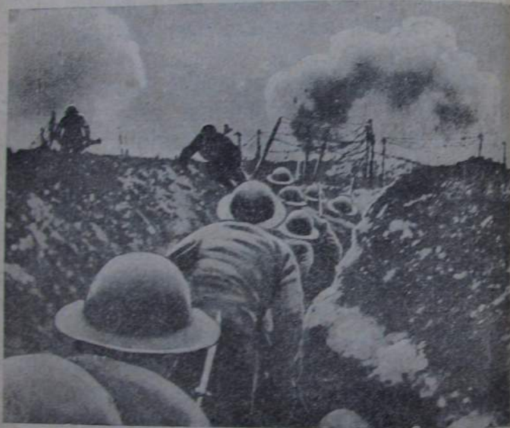
Buga uptattun kusi.

Təgəmər dawdinin əcən ğorojo bisi. Hawamnil, dunnəwə hawalzaril əzəgəl ajaraldirə