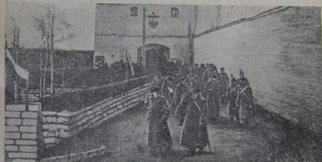
Policija təgəwkəkittula hawamnilwa əmərən.

Fabrikal həgdiməsəl ozacatin, hawamnil-da sotmarit əŋəsiwər mədəlzəcətin. Nuŋartin, fab- rikatikirdu, zawottikirdu umunupcənəl, umnət gorottu upkattun, rajondu upkattun stackal- dula, zabastowkaldula ugiriwugkitin. Ər stac- kal fabrikal nuŋəltin, təgəmər nuŋniwunin ŋə- liwsit tirəzəŋkitin. Nuŋartin hawamnilwa dugi- wurziwər dugiŋkitin, pəktirugkitin nuŋarwatin. Nuŋartin fabikaldukwar, zawodildukwar hawam-