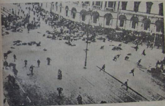
Leningrattu İjulgi ugiriwun.

3 irkin ğorcən iltəcələn hawalzaril tilcətin, kapitalistil adillaptidük nuğniwunduktin eja-da ajaja əjwətin alattə. Hawalzaril tugi-də tilcətin mensewikil, eseril sowetiltin, kapitalistilgidala zəzaril, eja-da əzəjəwətin burə. Hawamnil, dunnəwə hawalzaril ajat tilcətin, əjəsiwə gazadawər,