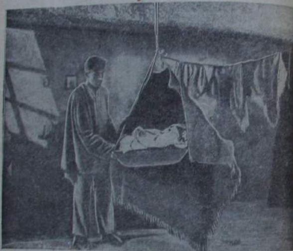
Hawamnil ucələpti binitin.

Anganiwa hawalzami, hawamni hawalnaliwi məɣunə ələ digrə ɣaŋkin. Umnə məɣunə ɣa- rakin, gewuldalan ɣaldalan məɣunɣilin anu- kitin. Nuɣədutin tar ɣan aja biŋkin. Nuɣan fabrikaduwi mənɣijəwi unijəkitjəwi (lawkəjəwi) niŋkin, nuɣandukin hawamnil unijəzədətin.