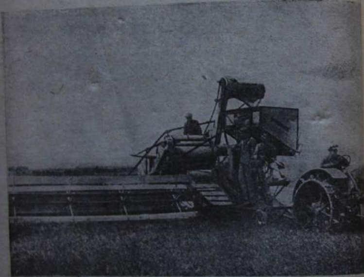
Kolhodir masinalsi cəməcilwə oroktolwo tawuwkil.

Tugi-də kupesilwa acingical bisip . Unikit upkacin gosudartwodu, kooperacijawoca. Gosudarstwojil unijəkicil, kooperatiw