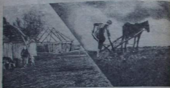
Krestjanisal—dunnəwə hawalzaril ucəŋtətil binitin, hawatin.

itiwuwcan. 1917 anganila upkacit itilzi, dunnə bajilsin tægəməŋ nugniwunin mənəkjəzəŋkin. Nugan dunnəŋicilnun bajasalnun, kapitalistilnun umukəndu hawalzarilwa kamatcaŋkitin tirətcəŋkitin. Upkat tægəl hawamniltin, dunnəwə hawalzariltin, urgəpcut hawalzanal, zəməmuzənal, so ərut (uhat) bişəŋkitin. Dunnəwə hawalzaril awdultin kətədiltin nədatal desitinal 1 dunnəŋiltin bişkitin. Haldutin