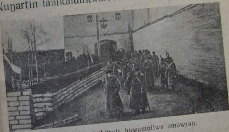
Policija təgəwkəkittula hawamnilwa əməwrən.

Fabrikal həgdiməsəl ozacatin, hawamnil-da sotmarit əŋəsiwər mədəlzəcətin. Nuŋartin, fab- rikatikirdu, zawottikirdu umunupcənəl, umnət gorottu upkattun, rajondu upkattun stackal- dula, zabastowkaldula ugiriwunŋkitin. Ər stac- kal fabrikal ŋuŋəltin, təgəmər nuŋniwunin nə- liwsit tirəzəŋkitin. Nuŋartin hawamnilwa dugi- wurziwər dugiŋkitin, pəktirunŋkitin nuŋarwatin. Nuŋartin fabikaldukwar, zawodildukwar hawam-